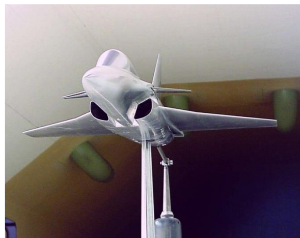
АЕРОТУНЕЛСКИ МОДЕЛ НАДЗВУЧНОГ АВИОНА У РАЗМЕРИ 1:15